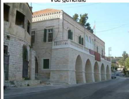
Maison à arcade